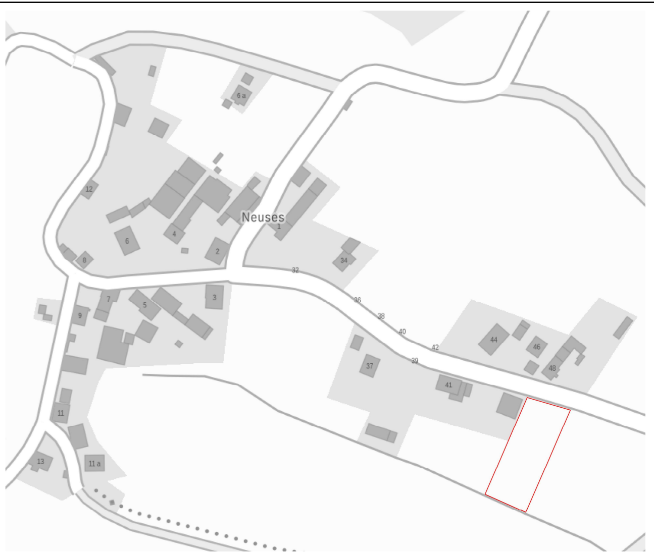
Übersichtslageplan